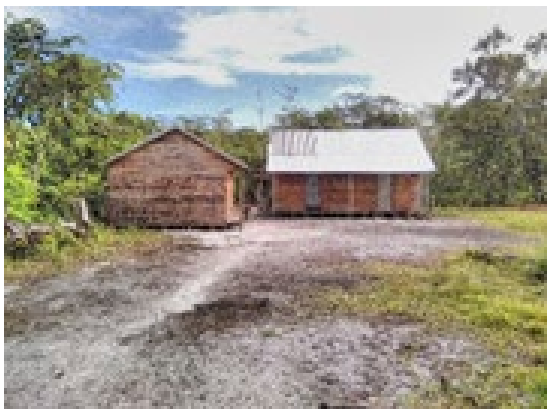
Foto 3 : Illegaler Bau inmitten des freistehenden Gebiets von Beankora

Die Arbeit des Parks wird schwierig, wenn es um den Umgang mit Interessenvertretern im Falle eines Meineids geht. Ein Leiter von Fokontany, zumal dieser gleichzeitig Präsident des Lokalkomitees des Parks (CLP) ist, wird als Partner in der Erhaltung des Parks angesehen. Dieser Mann setzt jedoch seit 2018 den Bau zweier Holzhäuser im Küstenwald des freistehenden Gebiets von Beankora einfach fort. Trotz der Verwarnungen der Parkmitarbeiter und des Leiters des Interventionsbereichs der Gemeinde Vinanivao wurde der Bau bis zur Vollendung fortgeführt.