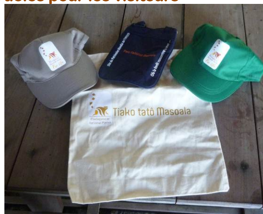
Photo 2 : Nouveaux articles de promotion : casquette, sac bandoulière, panier

Si d'habitude, la proposition reste sur des articles basiques, cette fois-ci la direction du Parc s'est lancée le défi de proposer de nouveaux articles à ses visiteurs : panier, sac bandoulière... L'objectif est triple : promouvoir le Parc, améliorer ses recettes annexes mais, par-dessus tout, satisfaire les visiteurs en leur proposant des produits diversifiés.