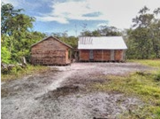
Photo 3 : Construction illicite à l'intérieur de la parcelle détachée de Beankora

Le travail du Parc devient difficile quand il s'agit de faire face aux parties prenantes en cas de parjure. Un chef de fokontany qui est d'autant plus le président du Comité Local du Parc (CLP) est considéré comme un partenaire de conservation du Parc. Ce gars-là persiste pourtant à bâtir deux maisons en bois à l'intérieur de la forêt littorale de la parcelle détachée de Beankora depuis 2018. Malgré les dissuasions des Agents du Parc et du Chef de Secteur d'intervention de la Commune du Vinanivao, la construction a été achevée jusqu'au bout.